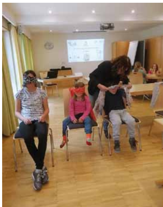
Un momento di gioco - Ein Augenblick des Spielens

Ho capito che non sono sola con la mia malattia